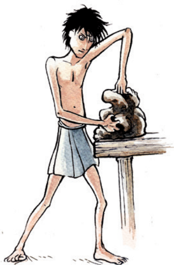
Illustrazione di Luca Tambasco

Ad adulti e bambini verrà proposto di calarsi nella realtà del lavoro quotidiano del restauratore; sarà possibile conoscere le caratteristiche della ceramica antica e le tecniche di lavorazione. In laboratorio i più piccoli potranno riprodurre un manufatto.