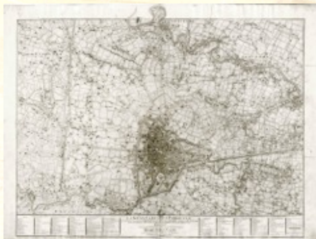
G.A. Rizzi Zannoni, Gran Carta del Padovano , f.1, 1780, BCPd RIP.XLIII.4014