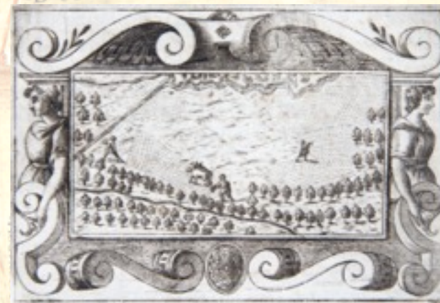
B. Breda, La campagna fuori dalle mura (il guasto) , BCPd BP. 324

Nello sfondo: elaborazione grafica da Nicolò dal Cortivo Carta del Padovano , 1534