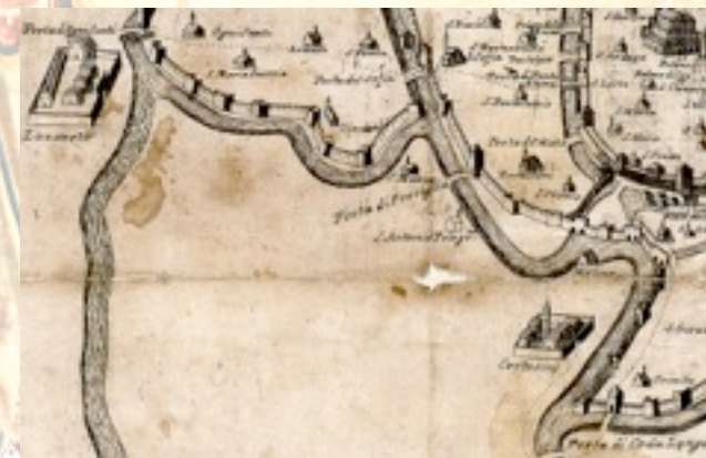
V. Dotto, Padova circondata dalle muraglie vecchie , 1623, BCPd RIP.VII.1056, particolare